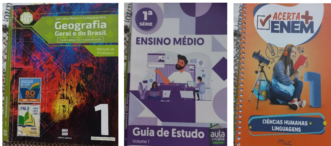
Figura 4 – Livros utilizados nas aulas de Geografia.