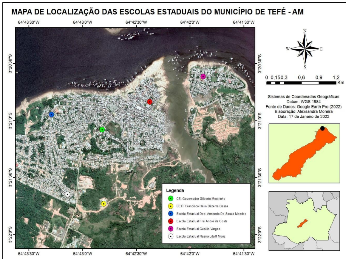
Figura 1 - Localização do município de Tefé - AM e as escolas pesquisadas