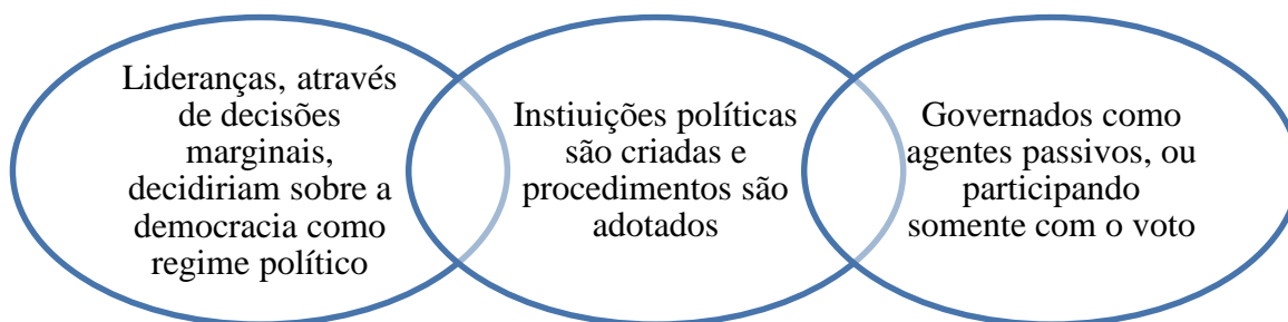
Figura 2: Sobre a racionalidade dos atores políticos, que conformam as instituições, que por sua vez formam os indivíduos, sempre como coadjuvantes de um processo mais amplo. Em algumas análises como as de Schumpeter (1984) os indivíduos aparecem no cenário político somente com o voto para escolher governantes, que por sua vez, tem uma carta branca para agirem, e sua responsabilização viria somente, por parte do eleitor, quando se operassem novas eleições.

Um dos problemas apresentados por interpretações que colocam demasiada ênfase às ações racionais por parte das elites, é que essas ações não se encontram dissociadas dos contextos sócio-históricos em que são inseridas. E há um ingrediente importante, como se verá a seguir, que é o papel das crenças e dos valores, ou seja, da cultura política onde essas decisões são tomadas. Elites políticas de determinadas nações dificilmente tomam decisões unilaterais, e nos raros momentos que as fazem, as crenças e os valores presentes no contexto sócio-histórico serão importantes condicionantes para os resultados desejados.